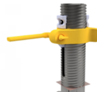
2 adaptateurs TP